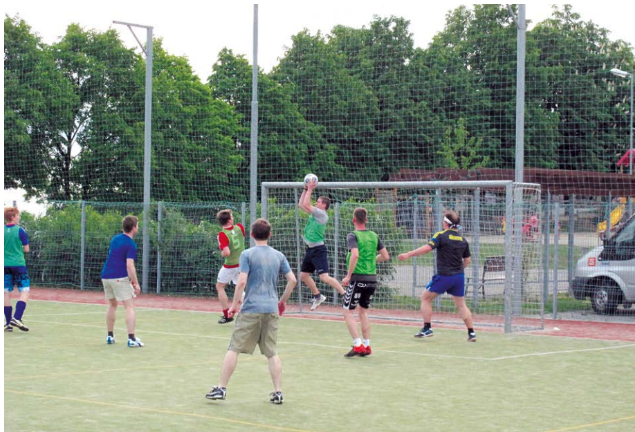
Ze Svatodušní pouti.